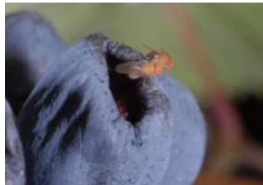
Abb. 1: Vorgeschädigte Beeren werden von Essigfliegen gerne befliegen.