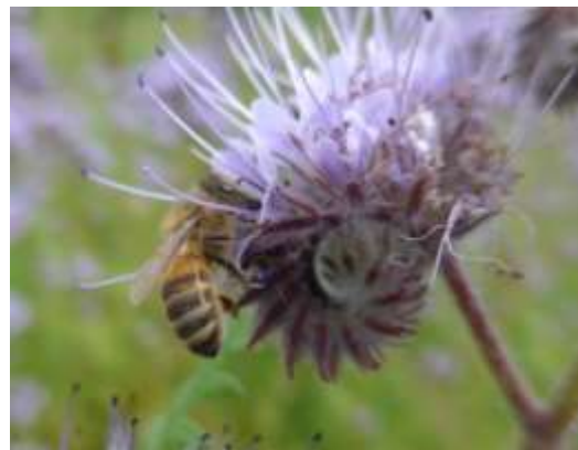
Abb. 6: Bei Bienenflug in der blühenden Begleitvegetation dürfen keine bienengefährlichen Pflanzenschutzmittel eingesetzt werden.

Vorbeugende Behandlungen vor dem Farbumschlag und nach der Ernte sind nutz- und wirkungslos. Nur zugelassene oder genehmigte Produkte dürfen verwendet werden und die Wartezeit ist einzuhalten. Aufgrund von Resistenzgefährdung sollten die Mittel entsprechend einem von der Beratung empfohlenen Resistenzmanagement (Wechsel der Wirkstoffe) eingesetzt werden. Besonders zu beachten ist die Bienengefährlichkeit einzelner Mittel.