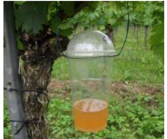
Abb. 4: Standardfalle mit Apfelessig-Wasser-Gemisch für das Fallenmonitoring.