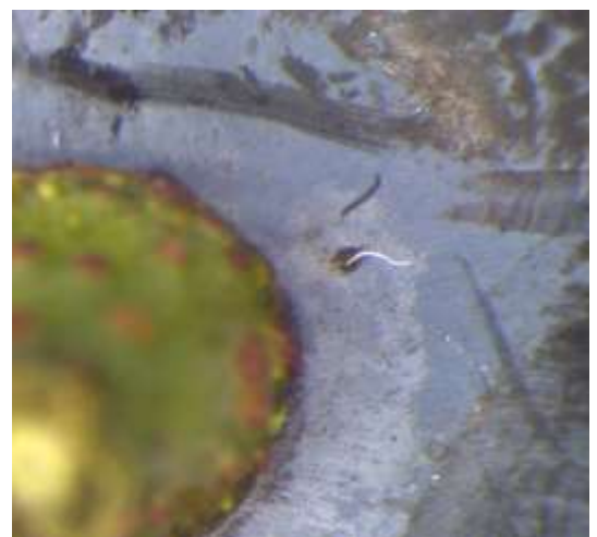
Abb. 5 oben: Probennahme für die Eiablage-Bonitur. Unten: Atemschläuche eines Eies in Stielnähe.