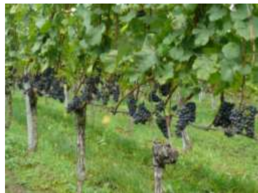
Abb. 3: In einer gut entblätternen und damit luftigen Traubenzone sind nachweislich weniger Kirschessigfliegen zu finden.